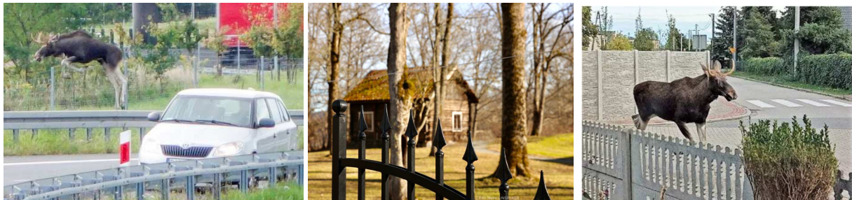
Przykładowe bariery antropogeniczne dla migrujących zwierząt i roślin

Przygotowywanie dokumentów planistycznych z pominięciem tych zasad niesie za sobą liczne zagrożenia zarówno dla przyrody, jak i dla funkcjonowania gospodarczego gminy i jakości życia mieszkańców. Dopuszczanie rozproszonej zabudowy, która bardzo często pojawia się na terenach cennych przyrodniczo, bezpowrotnie niszczy nasze środowisko, a także wpływa na ograniczenie swobodnej migracji zwierząt i roślin. Przykładem są korytarze ekologiczne łączące główny kompleks Kampinoskiego Parku Narodowego z jego otoczeniem, gdzie często zabudowa wkracza na tereny otwarte, pokryte lasami, tereny rolne, czy też podmokłe. Prowadzi to do ograniczenia możliwości swobodnej migracji fauny i flory, a w konsekwencji wymierania cennych gatunków.