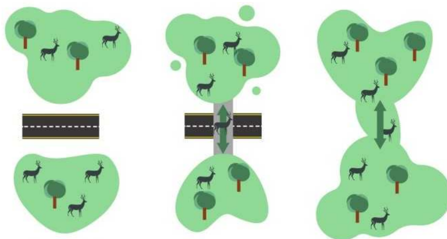
Tworzenie powiązania przyrodniczego poprzez korytarz ekologiczny nad drogą.

Takie gospodarowanie przestrzenią powoduje również problemy ekonomiczne gminy, takie jak budowa i utrzymanie wielu kilometrów dróg, sieci wodociągowych, kanalizacyjnych itp. Koszty „chaosu przestrzennego”, a w szczególności dopuszczania rozproszonej zabudowy poprzez wydawanie decyzji o warunkach zabudowy zostało wycenione w wynikach z kontroli NIK z lutego 2024 r. na 84,3 mld zł w skali kraju 1 , co daje średnio 34 mln zł na gminę.