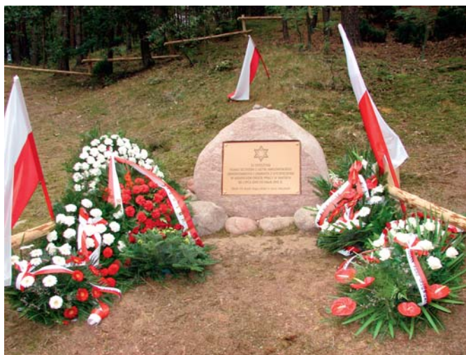
Kamień upamiętniający zamęczonych Żydów