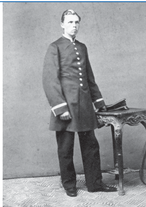
Zygmunt Gloger w wieku 19 lat

Gyby istniał tylko ośmiogodzinny dzień pracy – mawiał Zygmunt Gloger – byłby prawdziwą niedolą z powodu swej krótkości. Powiedzenie to wyjątkowo dobrze oddaje charakter Glogera oraz tłumaczy, dlaczego biografowie więcej mogą powiedzieć o jego pracy niż o życiu osobistym