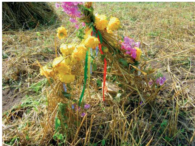
Żniwna „przepiórka”, czyli garstka nie zżętych kłosów zostawiona na polu dla zapewnienia plonów na następny rok. Zwyczaj oparty na dawnych wierzeniach ludowych

i trawy, a w środku pod źdźbłami winno się ułożyć płaski kamień, na nim kawałek chleba, dobrze jeśli posolony, nie byłoby źle położyć także pieniążek.