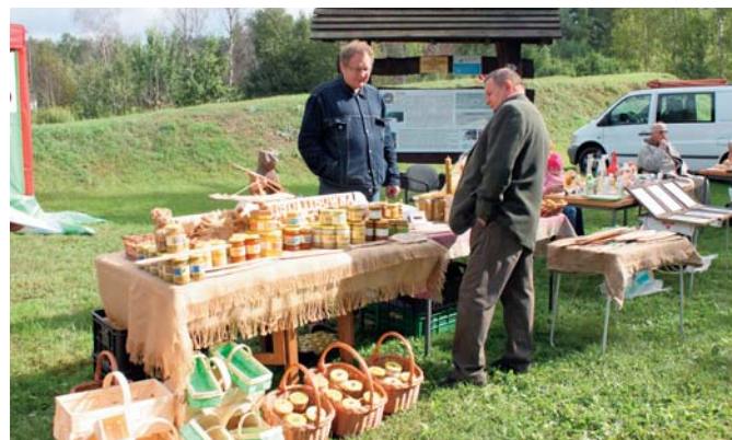
Nowością był kiermasz produktów regionalnych