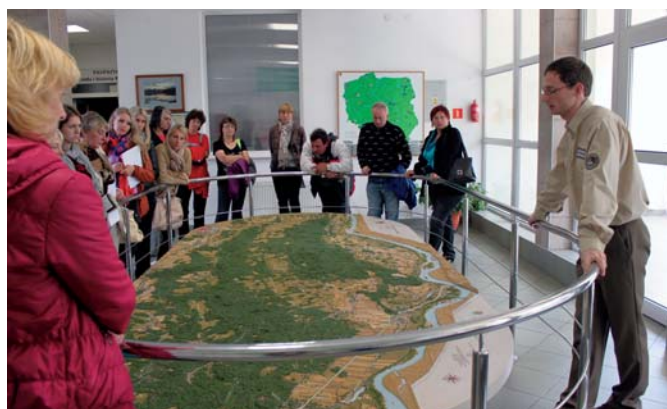
Odwiedzający chętnie oglądali mapę plastyczną park

specjalną kartę. Następnie posługując się planem sytuacyjnym, który rozdawaliśmy, i oznaczeniami w budynku odnaleźć pokój ornitologa, botanika, preparatora i entomologa. Wystarczyło uważnie wysłuchać tych specjalistów i odpowiedzieć na zadane przez nich pytania. Poprawna odpowiedź była warunkiem otrzymania pieczętki. W każdym z pokoi była oczywiście inna, m.in. z pająkiem, rysiem, sową. Wypełnioną kartę ze zgromadzonymi stempelkami należało wrzucić do oznaczonego pudełka z logo KPN, które ustawione było pod wiatą na polanie Jakubów. Zabawa bardzo się podobała. Wzięło w niej udział wiele dzieci, które z kolejnych pokoi wychodziły bardzo zadowolone.