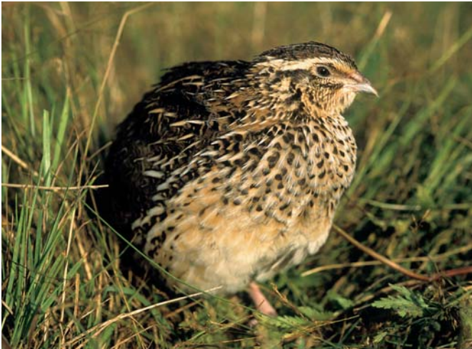
Przepiórka ( Coturnix coturnix ) prowadzi skryty tryb życia i częściej można ją usłyszeć niż zobaczyć. Gatunek objęty w Polsce ochroną ścisłą

skim można natknąć się na relikty, zdawałoby się, wymarłych obyczajów... Był upalny dzień po żniwach – szykowałem się właśnie do sfotografowania snopków zboża, ciągnących się rzędami, niczym miniaturowe piramid, po horyzont. Mogłoby się zdawać, że ugięte pod własnym ciężarem złote kłosa w snopach, to odwieczny, więc niezmienny widok, tak oczywisty