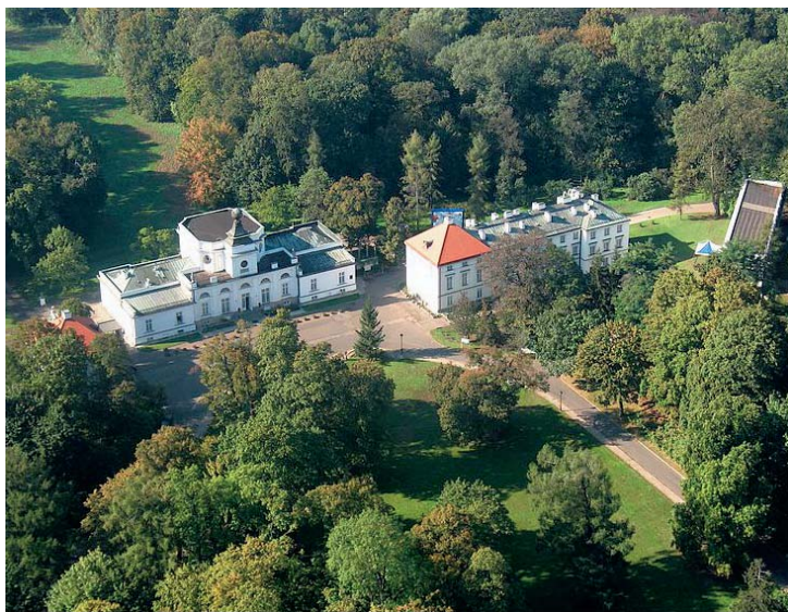
Jabłonna – zespół pałacowo-parkowy z XVIII w. za czasów Glogera prezentował się mniej imponująco niż obecnie

wisłana na jedynej znalezionej w tem miejscu iście przedhistorycznej łodzi, która widocznie od lat wielu nie służyła już ludziom do nawigacji. Na wybrzeżu łachy tłum robotników (sprowadzonych z nad górnej Wisły i Sanu) sypał kosztem właściciela ogromny wał ochronny, mający zabezpieczyć od wylewów Wisły. Za wałem tym zaczynał się park ogrodowy, nisko położony z ulicami do pałacyku wiodącymi. Królowały w tej części parku topole nawiślańskie, z których jedną mającą 7 metrów obwodu odfotografowaliśmy na wstępie. Przy pałacyku od strony Wisły w cienistych werandach i chłodnikach ustawiono kilkanaście starych rzeźb rozmaitych, widocznie przywiezionych tu z różnych dawnych pałaców. Cały skromny pałacyk i miejscowość pamiętna głównie jako wesoła rezydencja kawalerska księcia Józefa Poniatowskiego i obfitująca dawniej w liczne po nim pamiątki, robi dziś wrażenie cichego ustronia, przeznaczonego na uroczą siedzibę dla ludzi poważnej myśli i cichej pracy współczesnej, ludzi potrzebujących wytchnienia w cieniu tej wspaniałej zieloności po spełnieniu szlachetnych obowiązków obywatelskich, dla ludzi miłujących spokój wsi polskiej i zagon rodzinny.