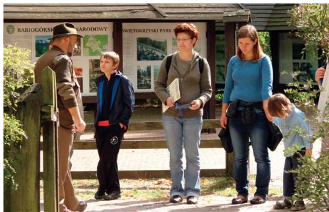
Wielu gości odwiedziło Ośrodek Dydaktyczno-Muzealny w Granicy