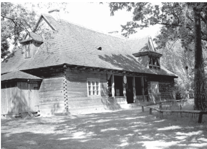
Siedziba nadleśnictwa Kampinos, stan w 1964 r.

Szczególną uwagę zwrócił Minister na organizację i rozkład pracy w tartaku, należyte i jak najoszczędniejsze wyzyskanie drewna kłocowego oraz sortowanie uzyskanego materiału tartego i wreszcie na system wynagradzania przed-