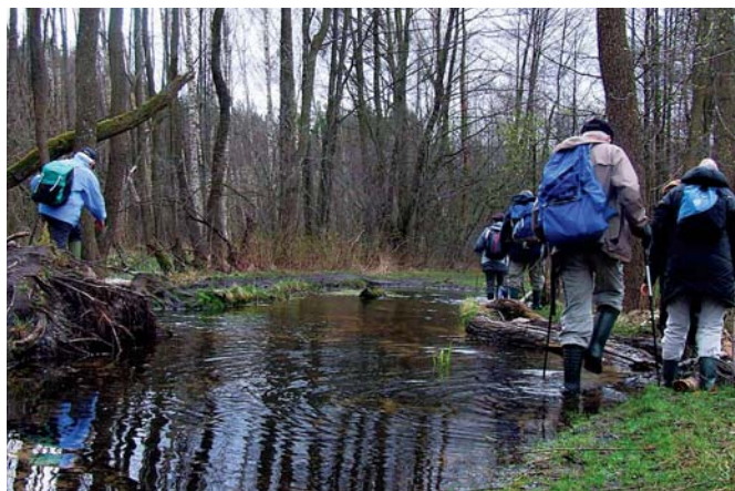
Na szlaku do Wyględ Górnych wiosną 2011 r.

Było to nieco więcej niż czterdzieści lat temu. W latach sześćdziesiątych XX wieku. Wędrując polną drogą na obrzeżach Puszczy Kampinoskiej, w okolicach dziś już nieistniejącej wioski Wyględy Górne, o dwadzieścia kilometrów od Warszawy, na skoszonym już polu dostrzegłem pęk nie zżętych kłosów. Sterczały chude i wysmukłe, związane u góry słomianą przepaską, w którą były wetknięte kolorowe, polne kwiaty. Wtedy przeszedłem obok, nie zatrzymując się. Nie wiedziałem, że minąłem obojętnie jeden z najbardziej interesujących żywych zabytków etnograficznych Mazowsza; ślad zachowania obyczaju, który był znany od wieków Słowianom, a także, acz w nieco odmiennej formie, starożytnym Grekom i Rzymianom.