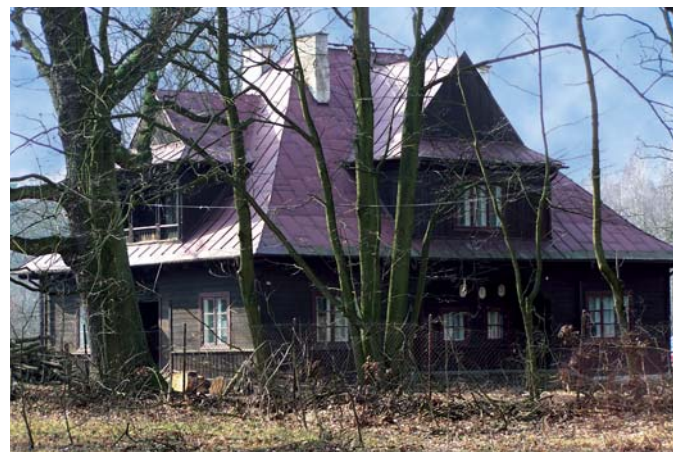
Jeden z zespołu drewnianych budynków nadleśnictwa Kampinos wzniesionych we wsi Granica w latach międzywojennych, stan w 2008 r.