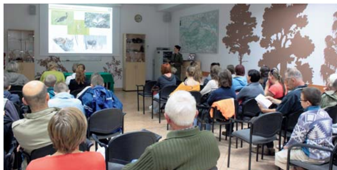
Tegoroczny dzień otwarty rozpoczęła prezentacja „Kampinoski Park Narodowy – turystyczna oferta dla społeczeństwa”