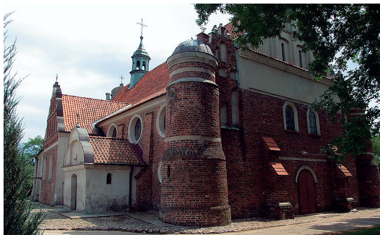
Zakroczym – kościół gotycko-renesansowy z 2 poł. XVI w. z charakterystycznymi okrągłymi wieżami, zwężającymi się ku górze