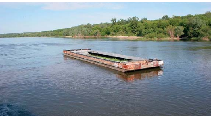
Współczesny gabar, czyli po prostu barka

Nareszcie ujrzeliśmy światelko w oknach domku, gdzie powinna była znajdować się przystań statków parowych pod Nowym Dworem. Była to istotnie ta przystań, w której zamierzaliśmy przenocować, składająca się z budynku postawionego na szerokim, pływającym gabarze uwiązany przy brzegu [gabar, franc. gabare, typ barki wykonanej ze stali, o konstrukcji wręgowej, w przekroju prostokątnej, na ziemiach polskich budowana od 1848 r. – przyp. AL].