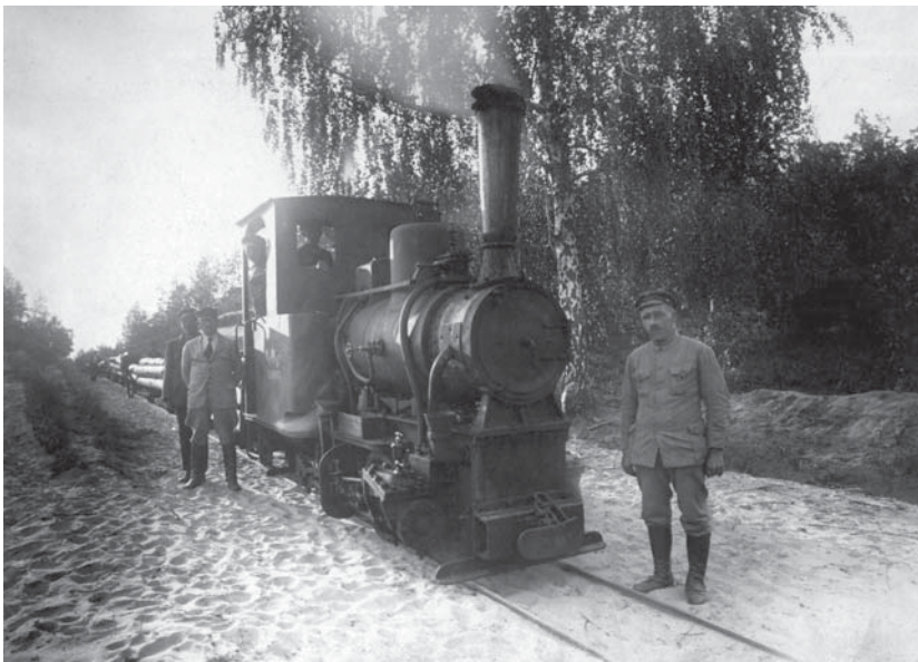
Kolejka leśna, którą dowożono drewno do tartaku