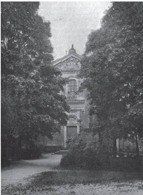
Kościół Kamedułów na Bielanych. Zdjęcie z 1899 r. zamieszczone w pierwszym wydaniu książki „Dolinami rzek”

Na cmentarzu przy murze kościelnym kazał pochować swoje śmiertelne szczątki wiekopomny ksiądz Staszic. Od-fotografowaliśmy jego grobowiec, ocieniony dziś pięknymi drzewami, na którym skromny czytamy napis: »Stanisław Staszic, urodzony 1755 r., dnia 20 stycznia 1826 r. umarł«.