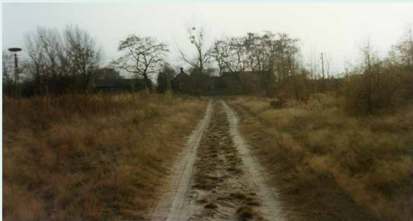
Wspomnienia uchwycone w kadrze...

brzymi wpływ na charakter tych terenów, na faunę i florę. Brakuje tej kampinoskiej „mokrej” wiosny, którą pamiętam jeszcze z lat 90. Przed nami jest więc wiele pytań i wiele wyzwań. Gdy spojrzymy jednak na ostatnie kilka wieków historii Puszczy, to przy całym tym dramatyzmie, z jakim się zetknęła, miała też bardzo wiele szczęścia. Dla przykładu potop szwedzki, który był dla naszego narodu największą katastrofą, dla Puszczy Kampinoskiej okazał się drogocenny. O cały wiek zatrzymał pochód człowieka do jej głębi i ocalił ją na dłużej. Gdy w końcu XVIII wieku tereny te przypadły Prusom, szykowany był