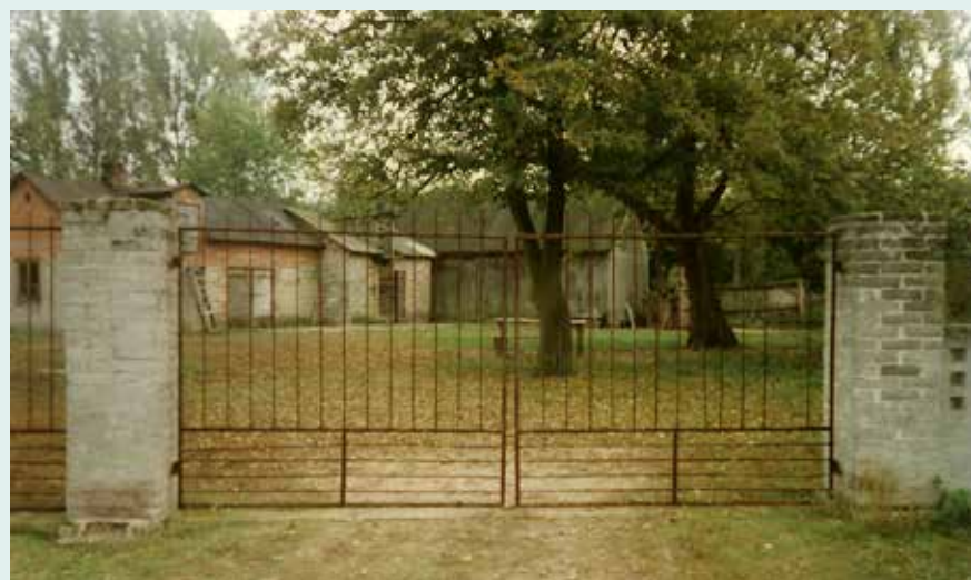
Po gospodarstwie pozostaną tylko ceglane słupy, Ławy, lata 70. XX wieku

która chciała dać o sobie znać i podkreślić swoje istnienie. A na strychu, w tym samym domu, mieszkała cała gromada nietoperzy. Któregoś dnia, tuż przed zachodem słońca, doliczyliśmy się ich ponad 70. Dobrze to pamiętam – były różnej wielkości i zapewne były to różne gatunki. Tutaj natura wszędzie była na wyciągnięcie ręki. Poznawałem ją nieustannie i ciągle byłem zaskakiwany jej obfitością i różnorodnością. Tego wszystkiego nie sposób zapomnieć. Myślę, że te obrazy w jakiś sposób ukształtowały mój stosunek do świata i przyrody. Ale wieś stopniowo ustępowała miejsca naturze. Ubywało gospodarstw. W ślad za odchodzącymi mieszkańcami znikwały pola i łąki, wszystko stopniowo dziczało. Natura wydzierała to wszystko, co niegdyś jej zabrano. Tu, gdzie jeszcze kilka lat temu rosoło zboże, teraz ku górze spoglądały młode modrzewie, sosny i dęby. W tym zmieniającym się środowisku niektóre gatunki czuły się lepiej, inne pewnie trochę gorzej, pojawiały się także nowe, a jeszcze inne emigrowały za człowiekiem. Ławy stawały się na powrót puszcza.