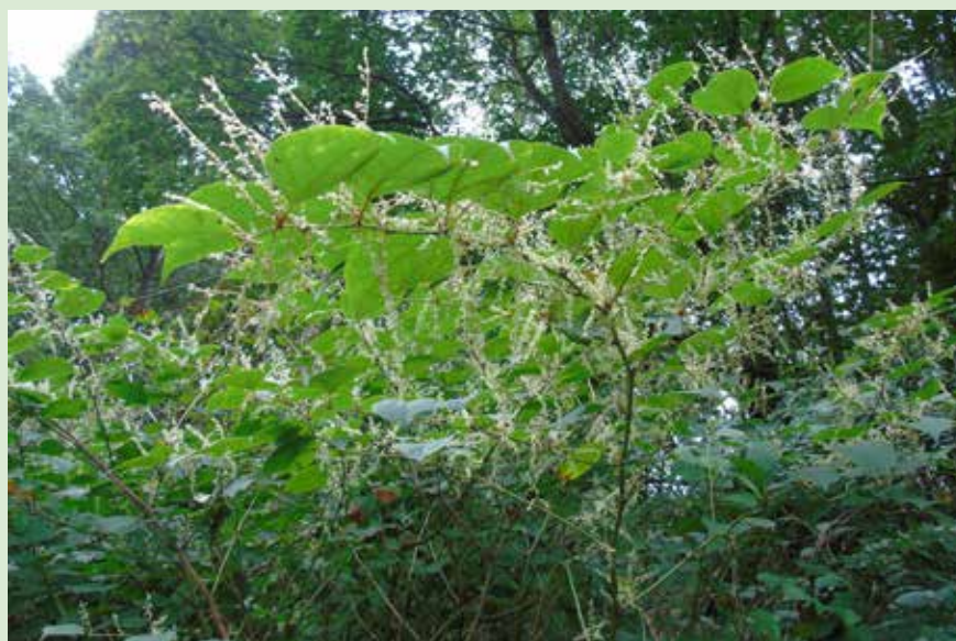
Rdestowce to jedno z najbardziej inwazyjnych roślin

Z roku na rok przybywa nowych stanowisk rdestowca w Kampinoskim Parku Narodowym i jego otulinie. Jeszcze w 2014 r., kiedy powstała publikacja Inwazyjne gatunki roślin w Kampinoskim Parku Narodowym i w jego sąsiedztwie pod red. A.