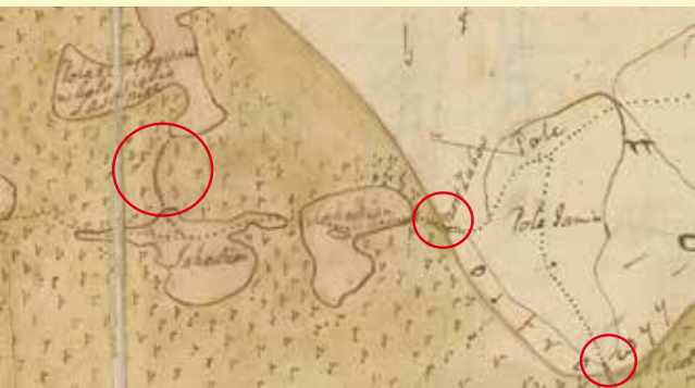
Fragment planu wsi Wieczerzewice z 1754 r.