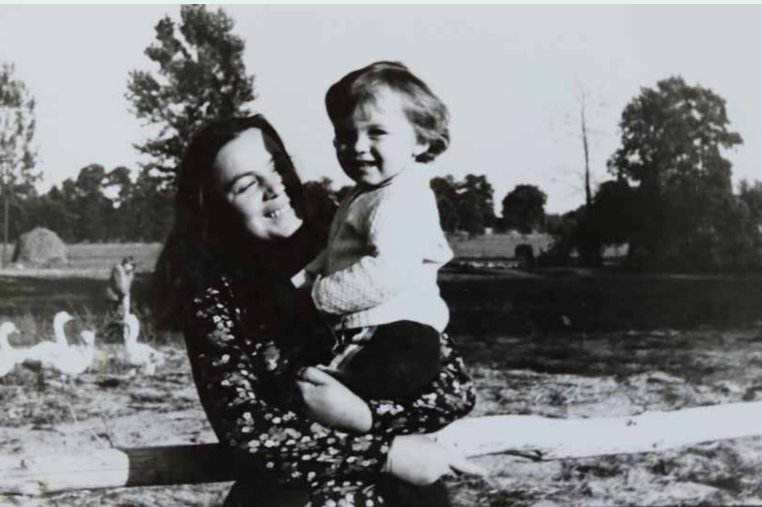
Obcowanie z naturą – niezwykle doświadczenie dla dziecka, Ławy, lata 70. XX wieku

– Tak. Wychowałem się w Ławach, to była wieś na północ od Zaborowa – była, bo już nie istnieje. Została objęta programem dobrowolnych wykupów gruntów przez Park. Tutaj, na Ławach, spędziłem wczesne dzieciństwo, a później bywałem bardzo często, aż do czasu, gdy dziadkowie się wyprowadzili. Ale z Puszcą