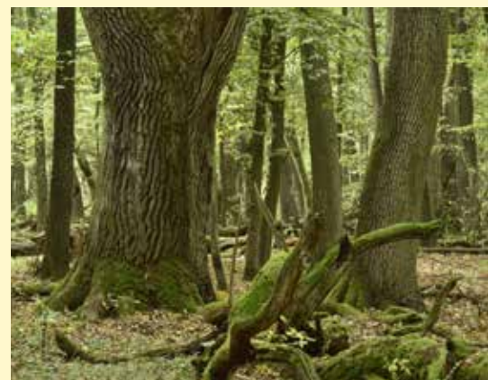
Majestatyczne dęby w Ławach

doświadczeniem. Idąc od strony Zaborowa najpierw niebieskim, a potem zielonym szlakiem, po minięciu Trytew i Wyględów Górnych, zobaczymy przed nami prostą drogę, która wprowadza nas w bardzo subtelny sposób w sam środek krajobrazu, który dziś istnieje już tylko na starych fotografiach i w ludzkiej pamięci. Tu, między wydrami, grondami, podmokłymi olsami i mokradłami centralnego pasa Puszczy Kampinoskiej w pierwszej po-