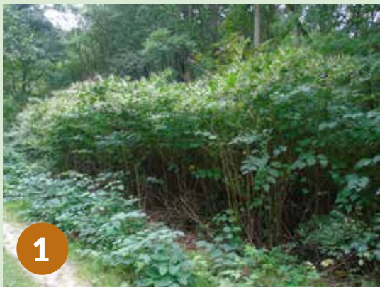
Wygląd stanowisk rdestowca przed zabiegiem: 1 – latem 2023 r., 2 – wiosną 2024 r. (tuż przed zabiegiem)