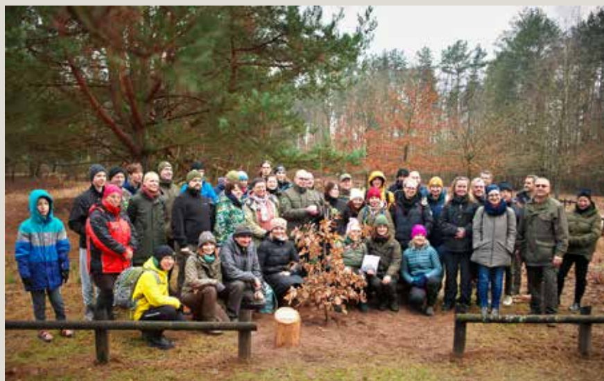
Liczna grupa wolontariuszy KPN, Granica, 2024 r.

T a data przejdzie do historii! 1 grudnia 2024 r. w Granicy do rosnących przy Alei III Tysiąclecia drzew dołączył kolejny dąb – „Wolontariusz”.