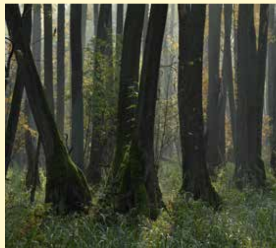
Ols w okolicach Ław