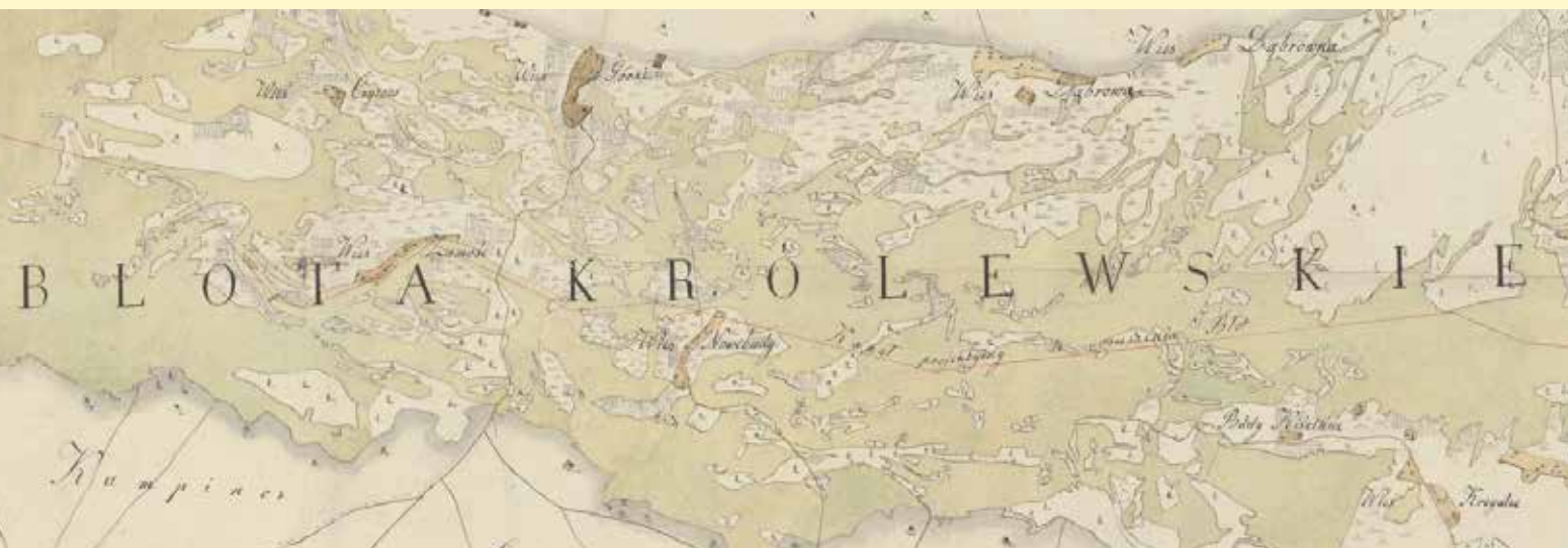
Fragment planu melioracyjnego środkowego pasa kampinoskich mokradeł z 1821 r.

Wygląda zatem na to, że nazwa „ława” mogła być związana z krajobrazem o częściowo antropogenicznym charakterze będących efektem adaptowania ówczesnych mokradeł do celów wypasu zwierząt gospodarskich 3 .